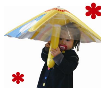
※幼児が持つ「はじめての傘」は開発時のものです